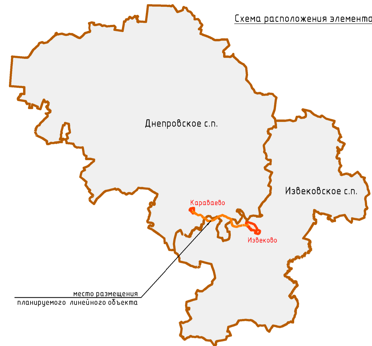
Схема расположения элемента планировочной структуры